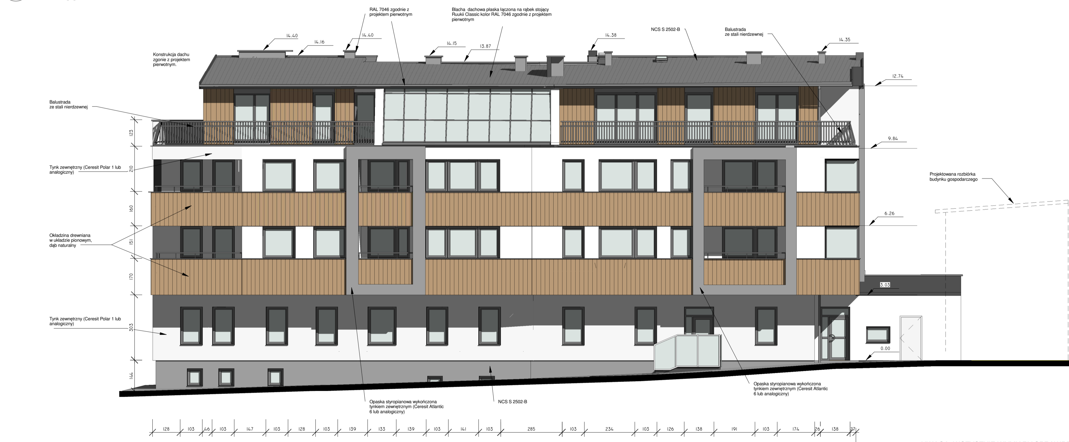
4 Elewacja Południowa 1 : 100

UWAGA: WSZYSTKIE WYMIARY SPRAWDZIĆ NA BUDOWIE